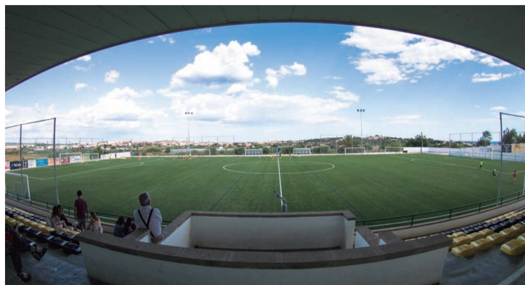
Gespa artificial. El camp municipal llueix aquest verd intens. Tothom, durant anys, ho prometia i nosaltres, que restàvem en silenci, ho vam fer. Moltes inversions i despesa anual elevada per tenir un dels estadis més bonics del Baix Gaià, on fa goig veure als nens i nenes fent l'esport.