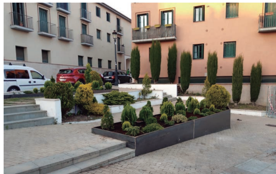
Molts parcs, moltes millores. Les petites actuacions també milloren el poble, algunes d'elles fetes pel magnífic treball de la brigada i altres per l'empresariat del poble. Teixint xarxa econòmica per donar oportunitats d'ocupació.