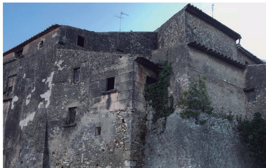
L'antic Hospital, patrimoni municipal. L'edifici més antic del poble ara és d'Altafulla. Una inversió que donarà servei i lluirà història. Si aconseguim subvencions del Ministerio de Fomento, l'obra es veurà molt aviat.