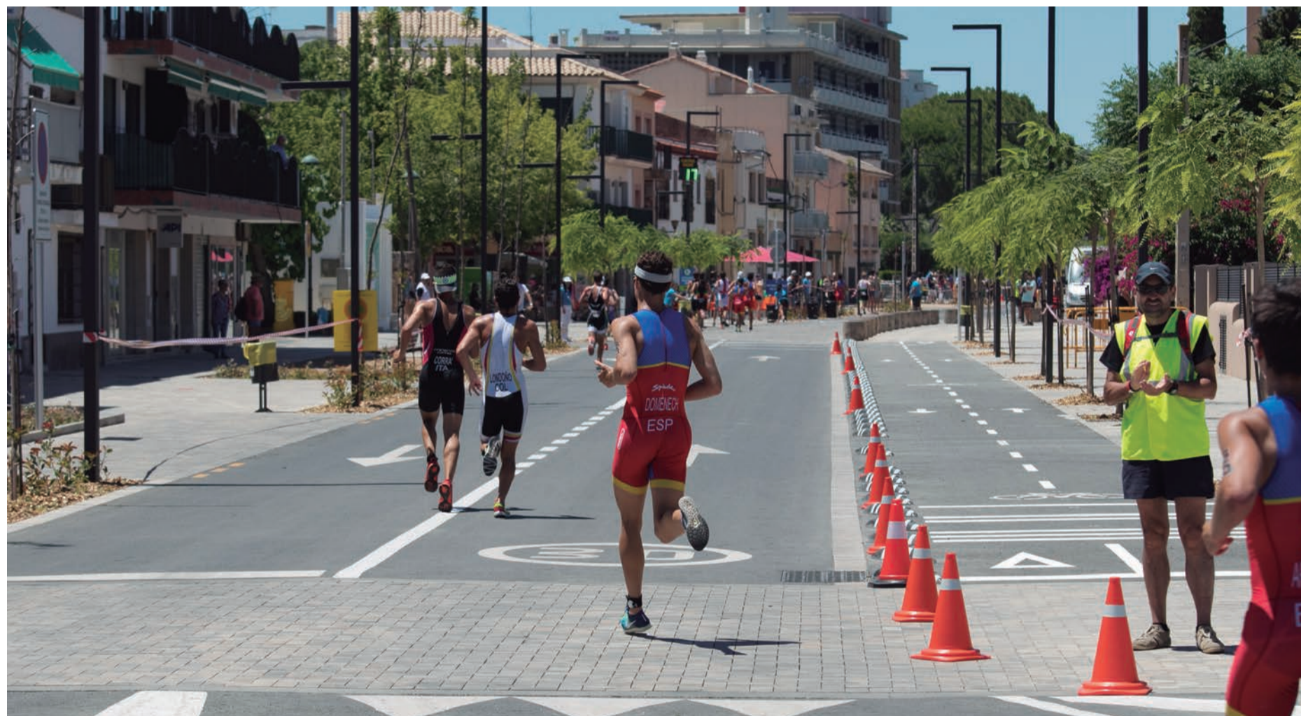
Remodelació de la Via Augusta, Fassina, plaça dels Vents i Boga. La inversió, finançada en una part important gràcies als Jocs Mediterranis, marca un abans i un després. Alguns van omplir de falsedats el poble però la realitat s'imposa. Avui tenim un magnífic espai on el comerç arrela amb força.