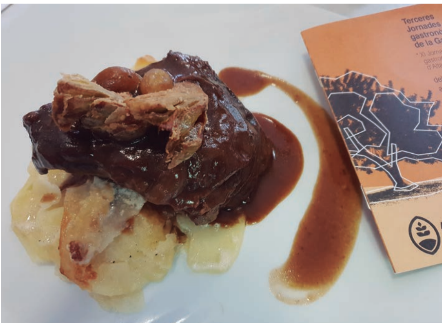
Jornades Gastronòmiques. De la Garrofa surt el millor dels nostres xefs que mariden tradició i bon gust