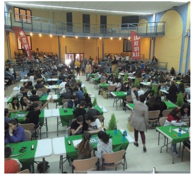
Scrabble. Enriquant l'idioma jugant des de petits