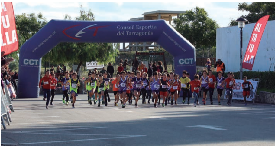
Cros d'El Roquissar. Nois i noies s'inicien en el més antic dels esports, l'atletisme