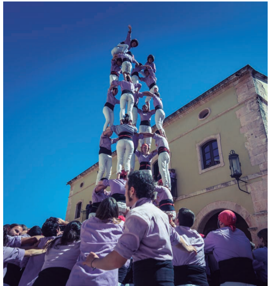
Diada Castellera de les Cultures. Pit i amunt