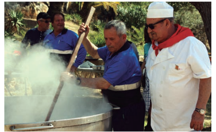
Festa de l'Olla. El bon gust de menjar en companyia