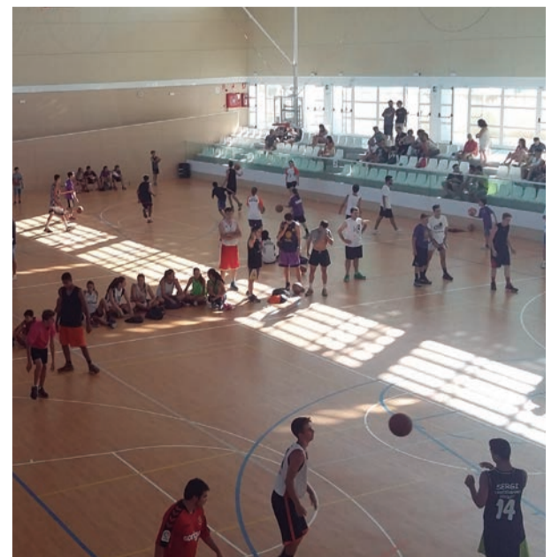
Bàsquet de promoció. El poliesportiu, amb equips de 3x3 que es multipliquen cada any