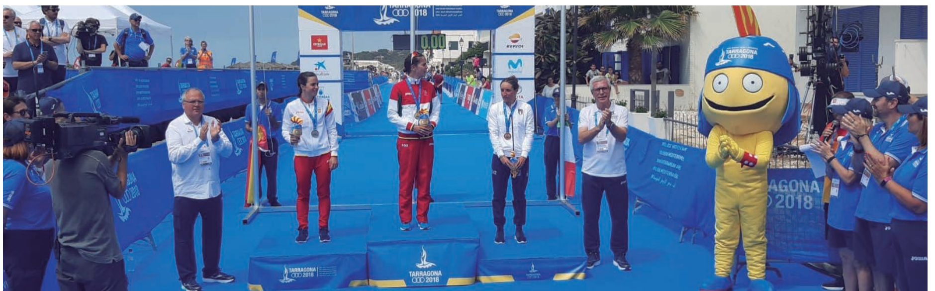
Podi d'èxit. Honor i orgull d'una revetlla de Sant Joan per a la història d'Altafulla