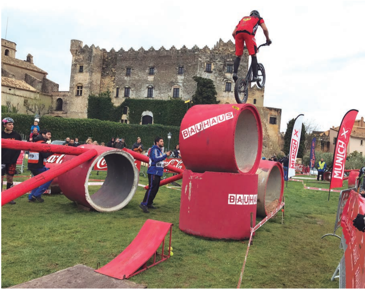
Bike Trial. La seu més espectacular amb els millors pilots del món