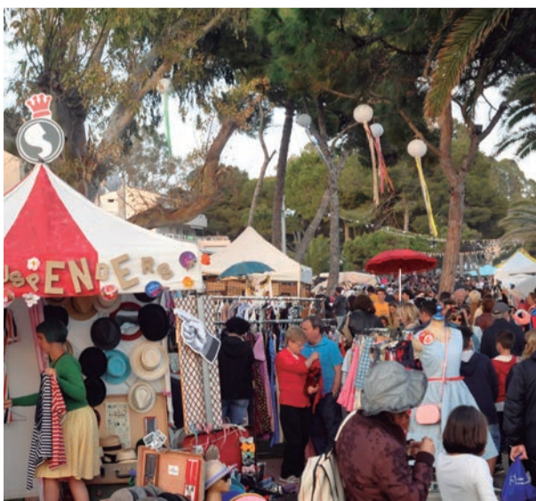
Pleamar Vintage Market. La modernitat i lo retro, una combinació que es fusiona al costat del mar