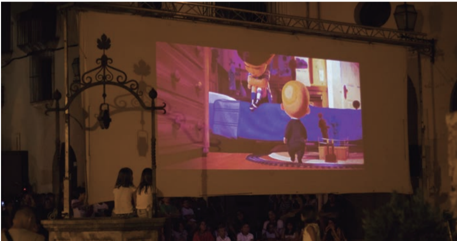
Cinema a la fresca. Les pel·lícules surten al carrer per gaudir d'un estiu en família