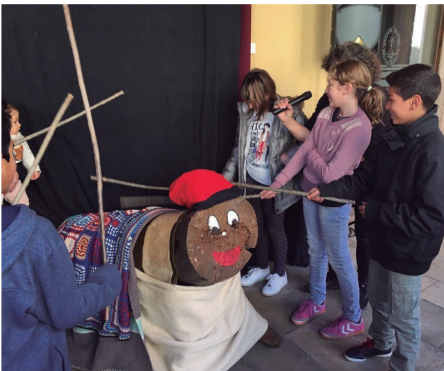
Tió. Cops de bastó. Avellanes i torrons. Pica ben fort!