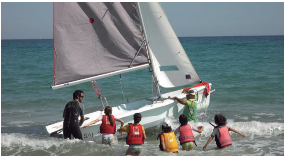
Vela escolar. Viure el poble de cara al mar, aprenent a navegar