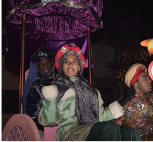
Cavalcada. Melchior, Gaspar i Baltasar. Els colors d'una nit màgica