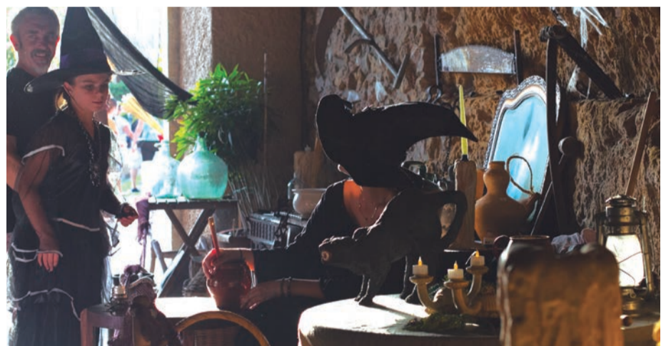
Nit de Bruixes. Esoterisme, màgia i llegenda. Les bruixes, una poció de saber popular