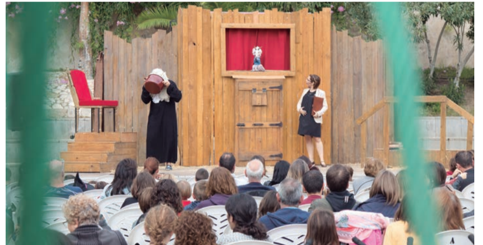
Sant Antoni. Amb la 'Petita' gaudim d'activitats que fan poble