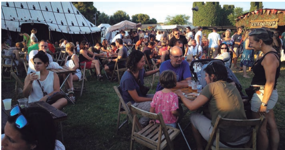
Fira d'Artesans. La tradició dels oficis exposats en unes nits d'estiu que són cita obligada