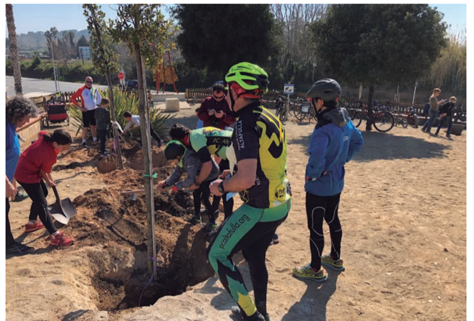
Dia de l'arbre. Excursió en bici i plantar arbres en la vila florida