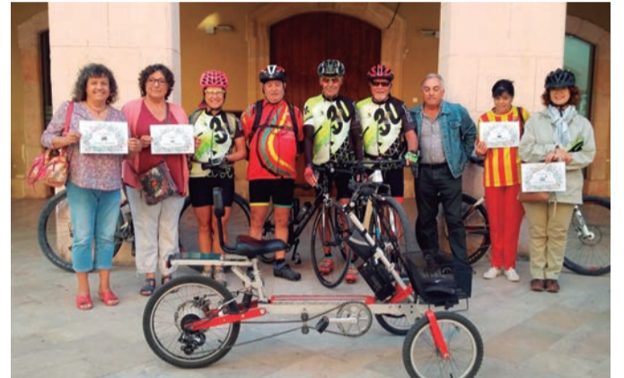
Setmana de la mobilitat. El més ràpid no sempre és el més contaminant