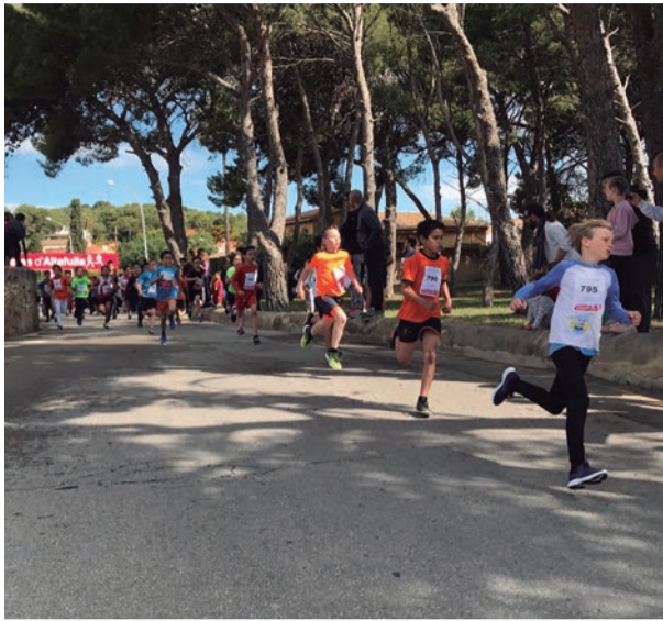
Cursa 1r de maig. Una marea de gent fent esport i salut