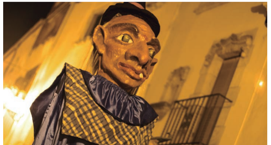
Gegants i nans. Els més petits gaudeixen i fan volar la imaginació