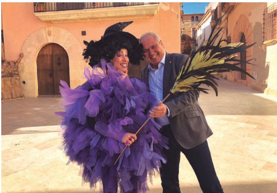
Tapes bruixes. La Xoixeta ens porta el millor recorregut per descobrir tapes plenes de sensacions