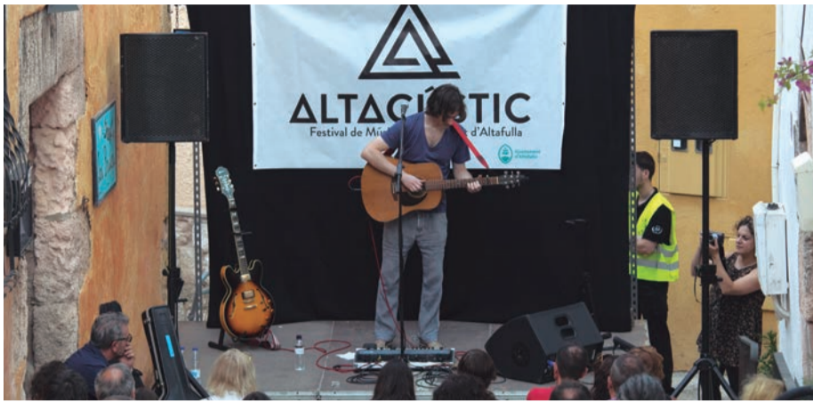
Altacústic. Les noves tendències musicals ressonen a la vila closa