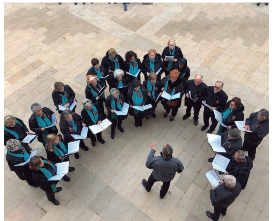
Fira de Nadal. Nades amb el cor d'on neixen els Nous Rebrots