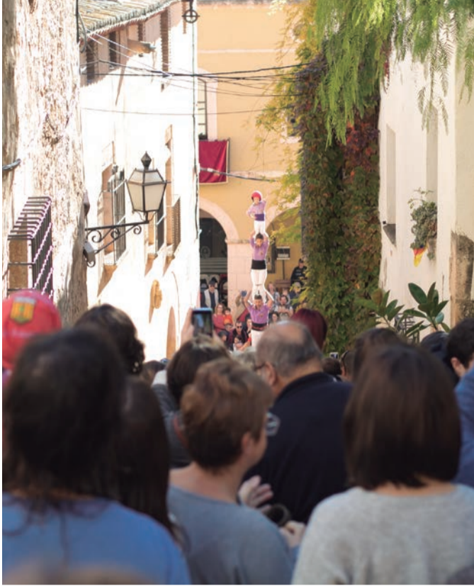
Sant Martí. El pilar d'un poble que fa seva la Festa Major