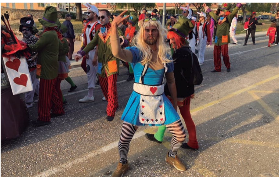
Carnaval, Carnaval. Disbauxa, 'carrosses' i jovent. El rei carnestoltes governa amb mà de ferro i, per sobre de tot, amb diversió