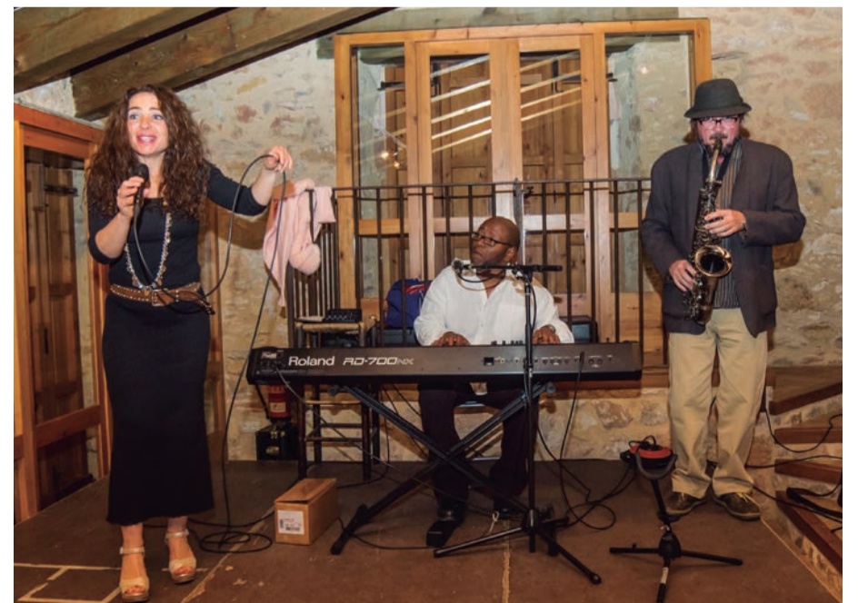
Altafujazz. Una cava de prestigi que ens posa en primer pla de la cultura