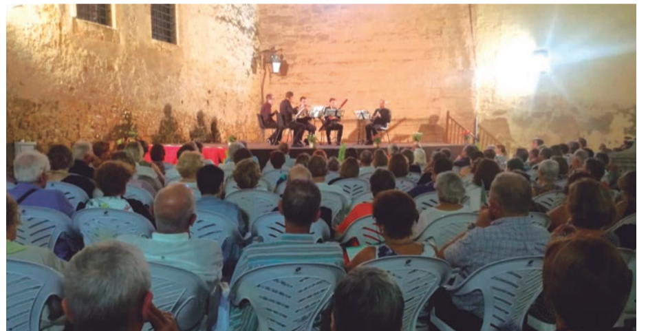
Festival Internacional de Música. La plaça de l'Església es converteix en el millor auditori a l'aire lliure