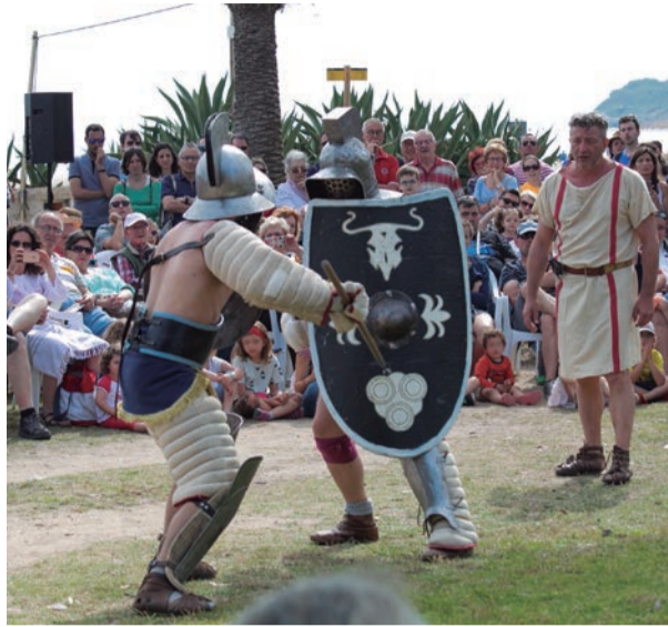
Tarraco Viva. Gladiadors i romans, un llegat que ens recorda que som Patrimoni de l'Humanitat