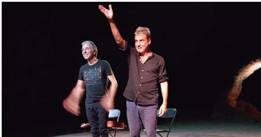
Escena Altafulla. Les arts escèniques s'expressen en una Altafulla que és sinònim de cultura de qualitat