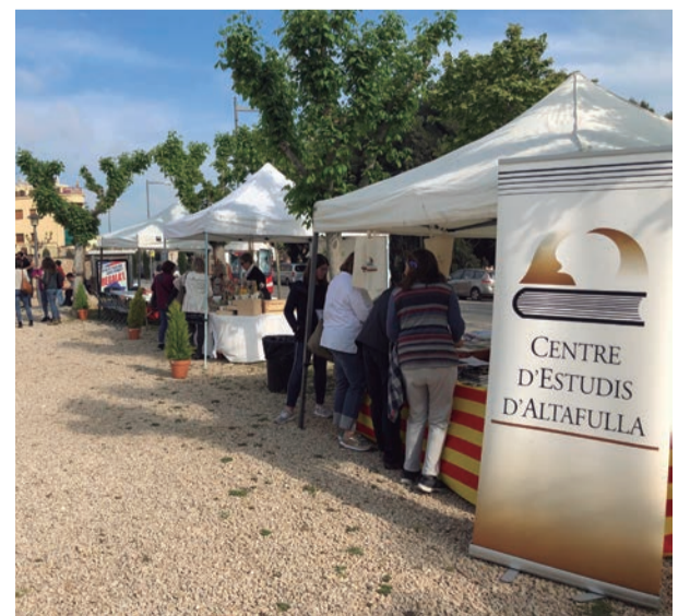
Sant Jordi. Llibres i roses ocupen el carrer