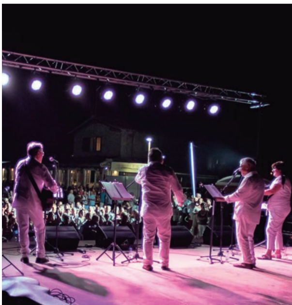
Havaneres. 'Quan el Català sortia a la mar els nois d'Altafulla solien cantar...'