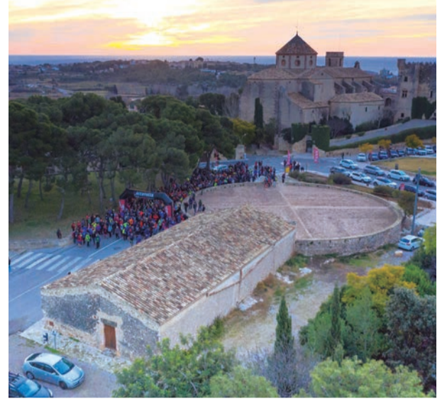
Marxa dels Castells. El patrimoni del Baix Gaià, de castell en castell