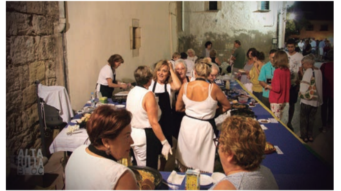
Festa de les Cultures. Plats que apropen cultures a aquells que són benvinguts a una vila oberta al món