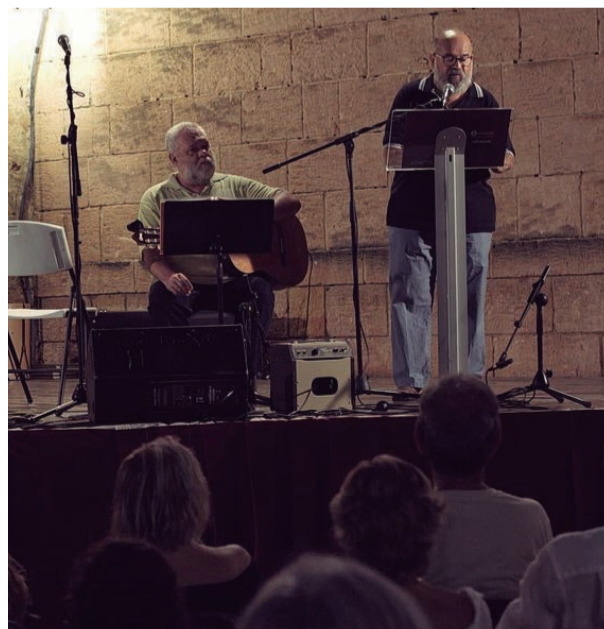
Nit de Poemes. Una sonoritat profunda per acabar l'estiu tot recordant que les teclades inicials ressonen a Fonxo