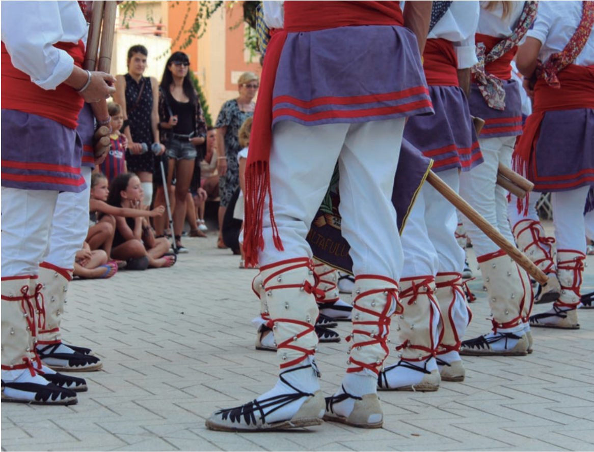
Cercavila. Bastoners, Gegants i Nans són el sabor imprescindible d'una Altafulla que balla al ritme de la tradició popular