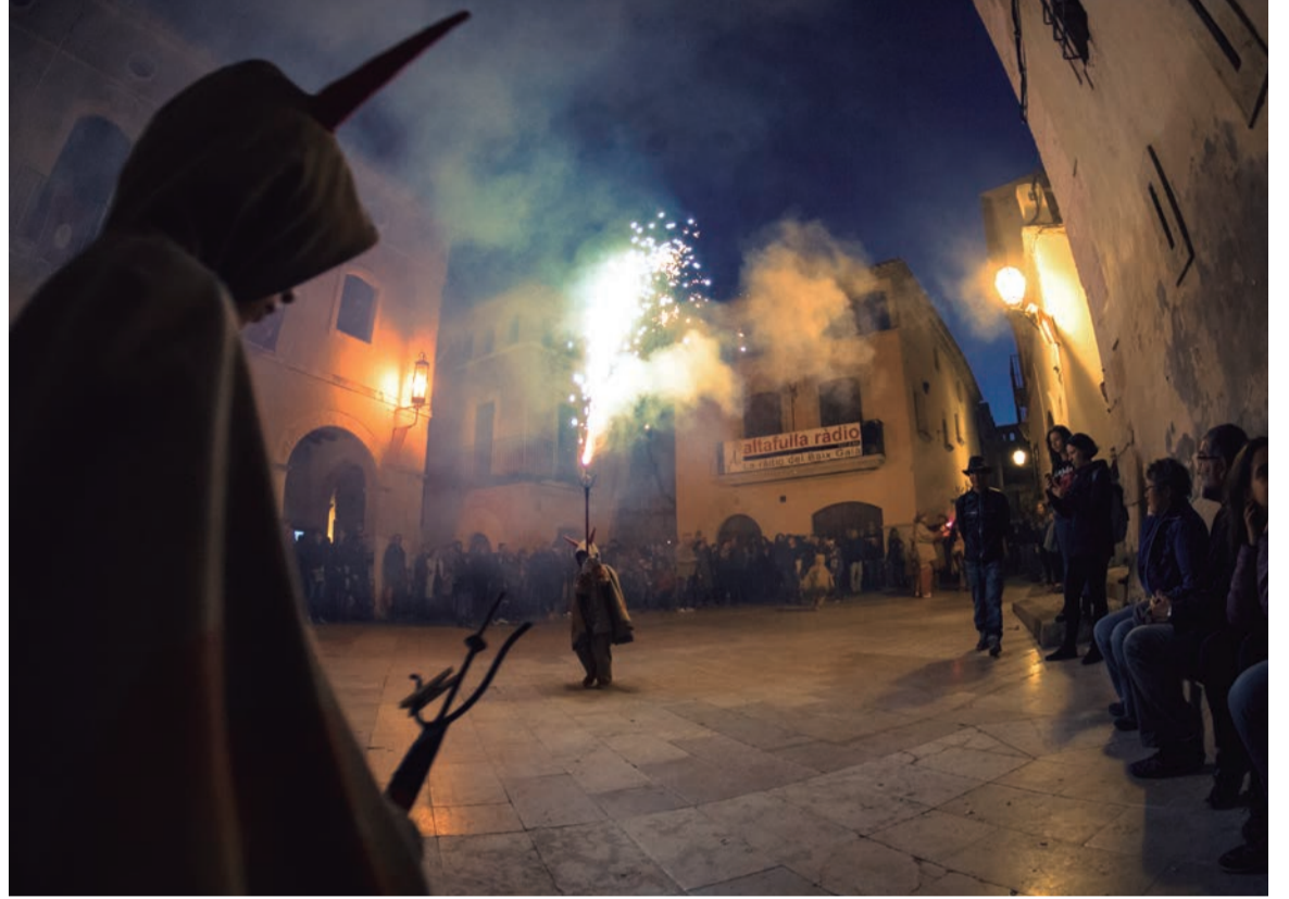
Diabla. Foc, fum i versots per cremar la nit i el que calgui