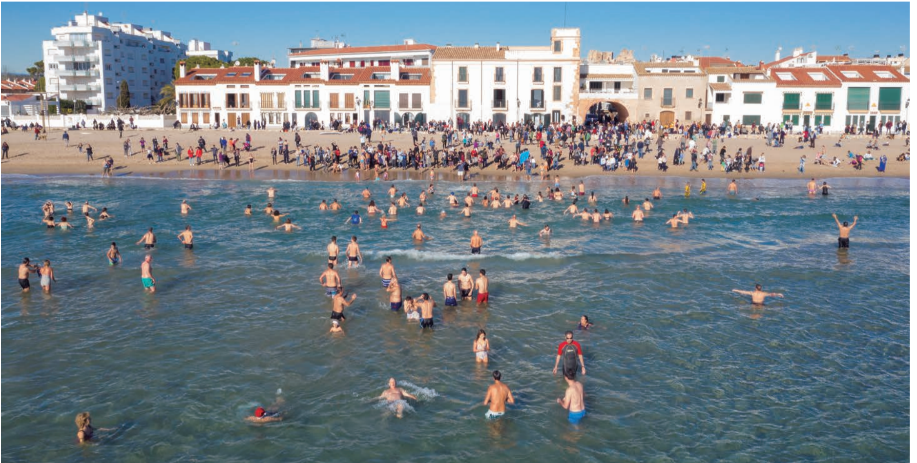
Primer bany de l'any. Germanor i bons desitjos per començar l'any amb esperança. Mullar-se per un poble amb sabor mediterrani