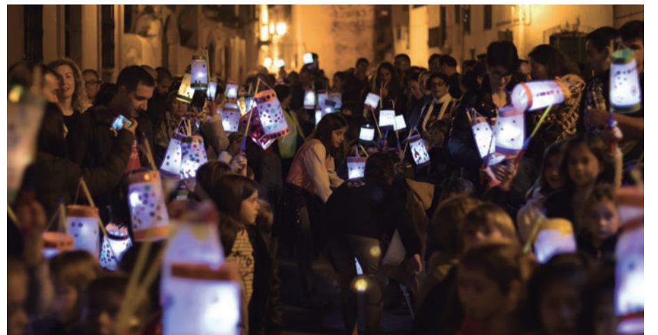
Rua dels Fanalets. Llum per il·luminar la nit. Esperant l'arribada de Sant Martí i la seva capa protectora