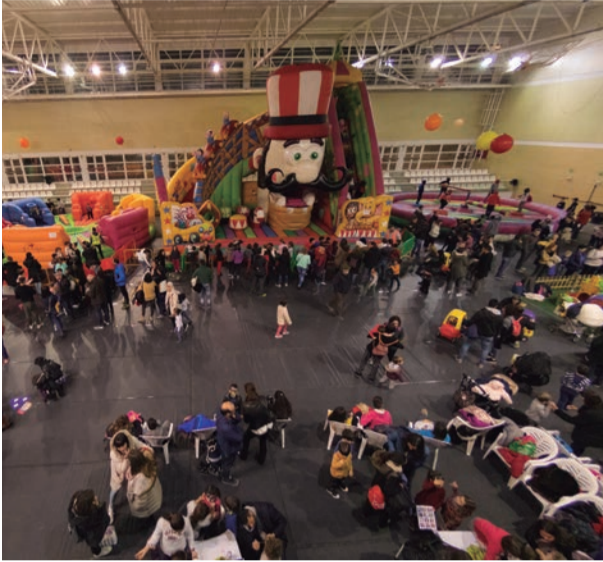
Parc de Nadal. La mainada d'Altafulla tres dies donant salts d'alegria