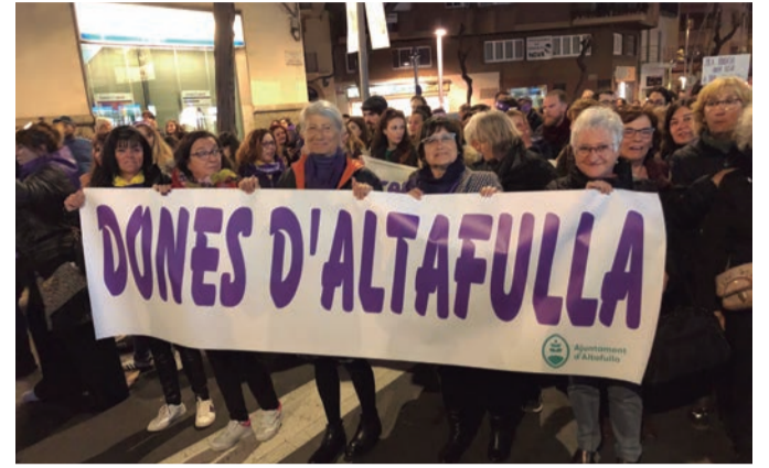
8 de març. Les dones lluitant per ocupar el lloc que les correspon. Altafulla amb ulls de dona