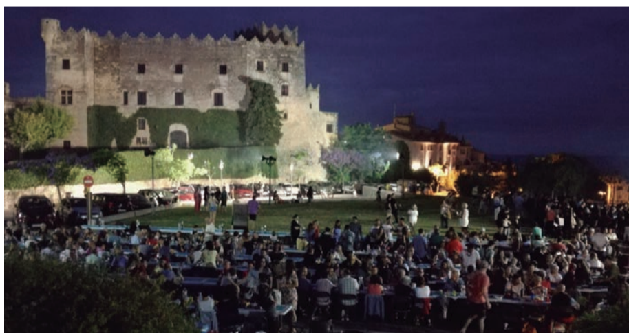
Sant Joan. El foc que crema les coses velles i encén espurnes de somnis