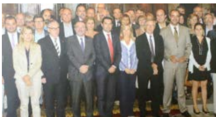
Consell de Governos Locals de Catalunya

Alcaldes de totes les forces, menys del PP, denuncien la reforma local que prepara el Govern per considerar que "amputa" l'autonomia local i deixarà els ciutadans sense prestacions bàsiques, sobretot socials, com la teleassistència, l'educació extraescolar o l'ajuda a domicili. la reforma local, que l'Executiu vol que entri en vigor l'1 de gener