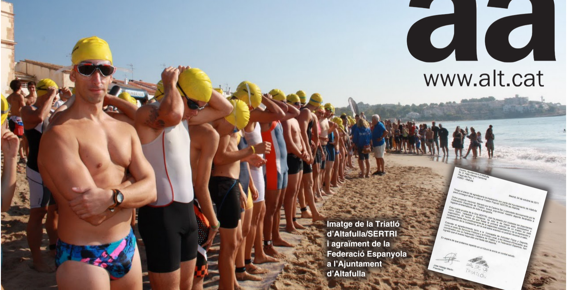
Imatge de la Triatló d'Altafulla/SERTRI i agraïment de la Federació Espanyola a l'Ajuntament d'Altafulla