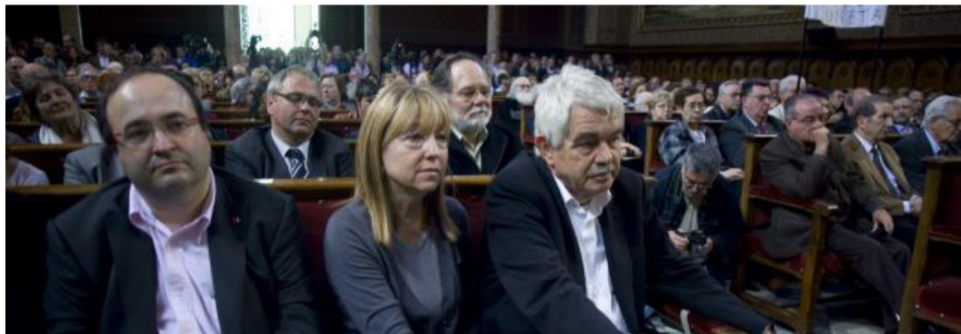
Imatge de l'acte celebrat al paranimf de la Universitat de Barcelona durant l'acte de suport al jutge Garzón

5.- Donar trasllat d'aquests acords a totes les forces polítiques catalanes amb representació parlamentària, al Govern de la Generalitat, al Parlament de Catalunya, al Govern Espanyol, al Congrés i Senat espanyols, al CGPJ i a les associacions de jutges i fiscals de Catalunya i l'Estat.